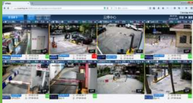
车道监控及车辆信息显示