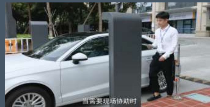
呼叫现场保安，处理应急情况