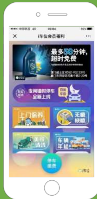
广告页面招商推广