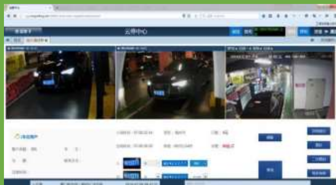
异常报警及云端处理异常