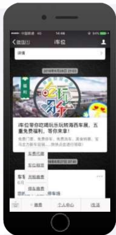
公众号嵌入缴费功能