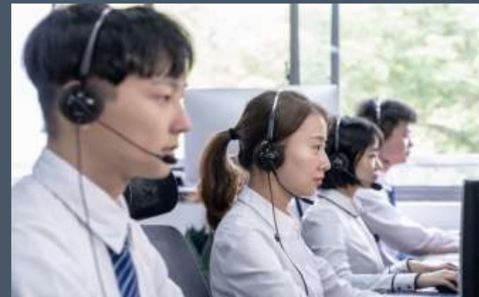
语音对讲功能，服务解决车主困惑